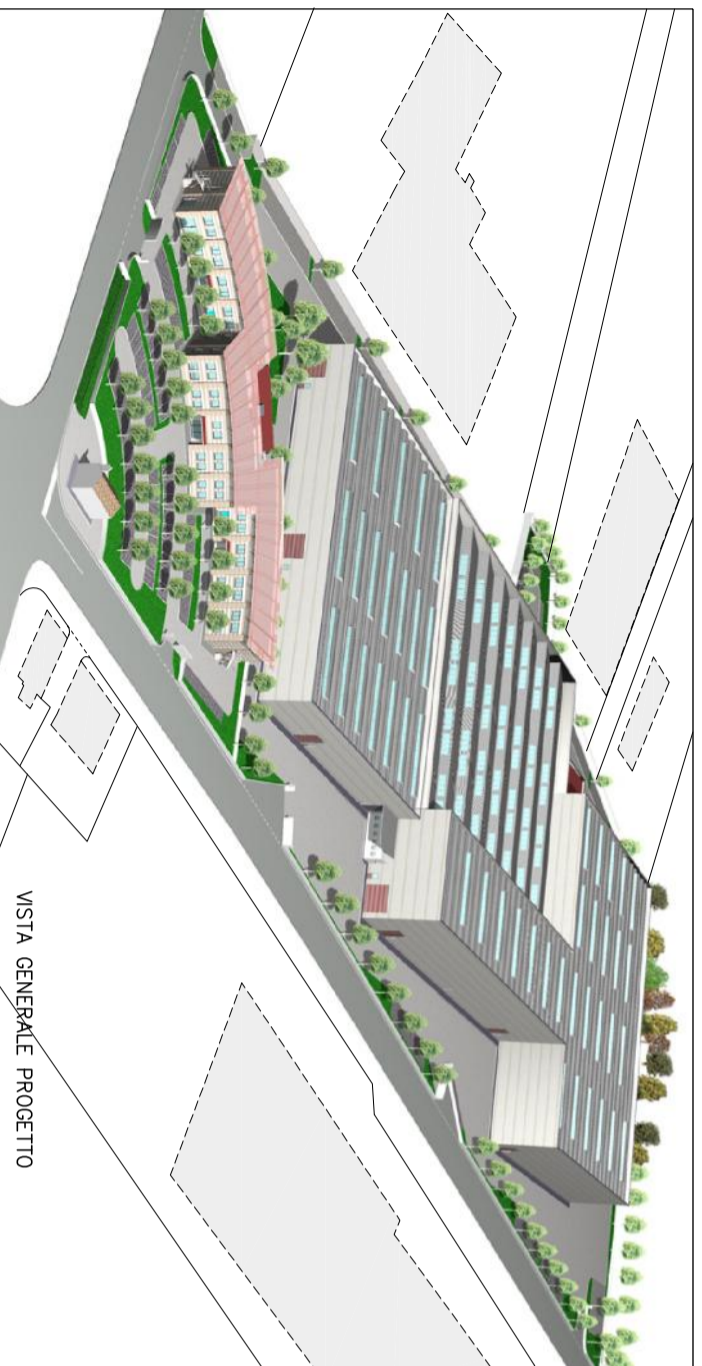
VISTA GENERALE PROGETTO