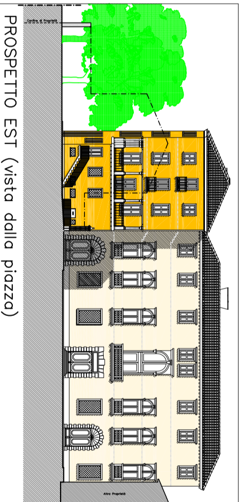
PROSPETTO EST (vista dalla piazza)